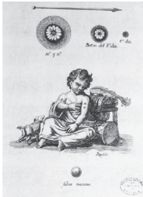
Figura 1 4