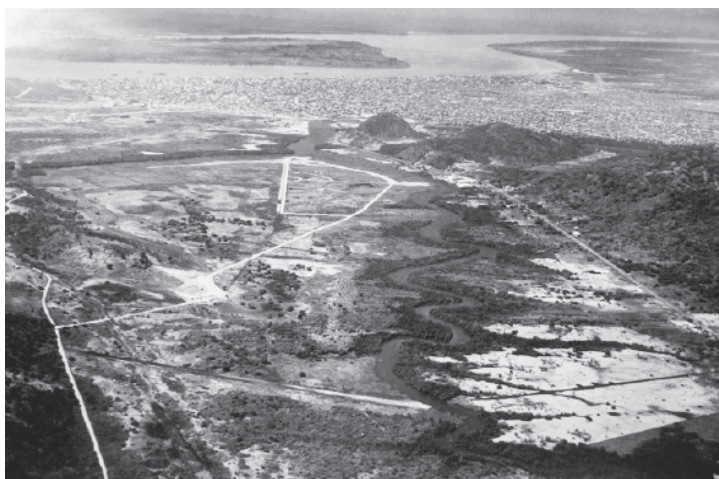
Vista aérea de la ciudad de Guayaquil. Observamos trazado de manzanas y solares de la nueva urbanización Al fondo la ciudad, el río Guayas