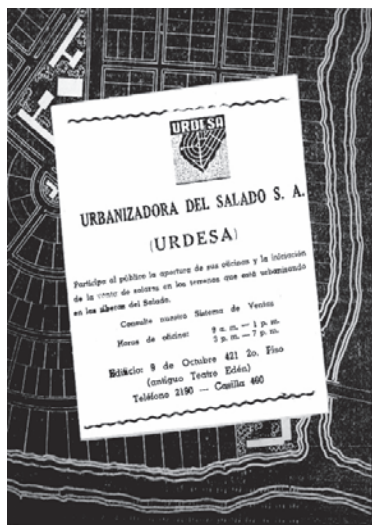
Primer anuncio de “URDESA”, publicado en los diarios de la ciudad. La Nación . 3.IV.1955

“URDESA” construyendo hoy el Guayaquil residencial de mañana