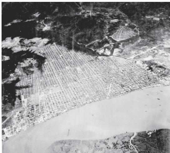
Vista aérea de la ciudad de Guayaquil, de este a oeste. Observamos hacia el noroeste la implantación de "URDESA"