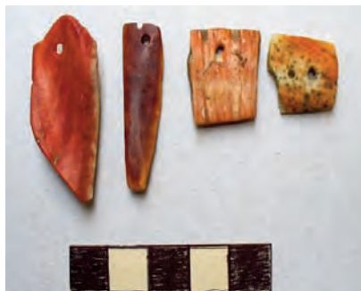
2.- Ornamentos de concha Spondylus