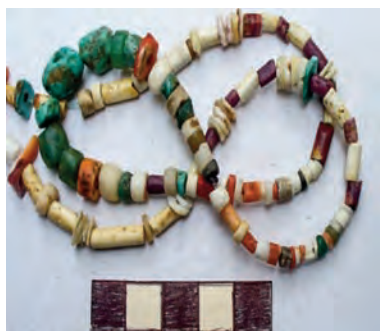
4.- Collar de mullos (Cerro Narrío)