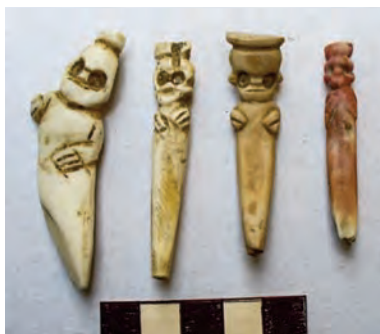
3.- Figurillas humanas (Ucuyayas)