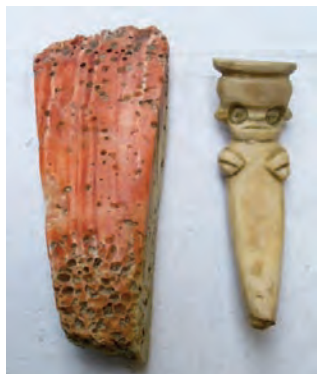
1.- Concha Spondylus y figurilla humana