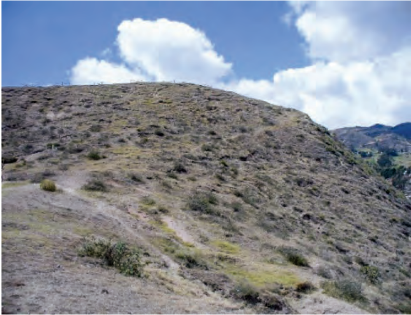
Sitio arqueológico Cerro Narrío