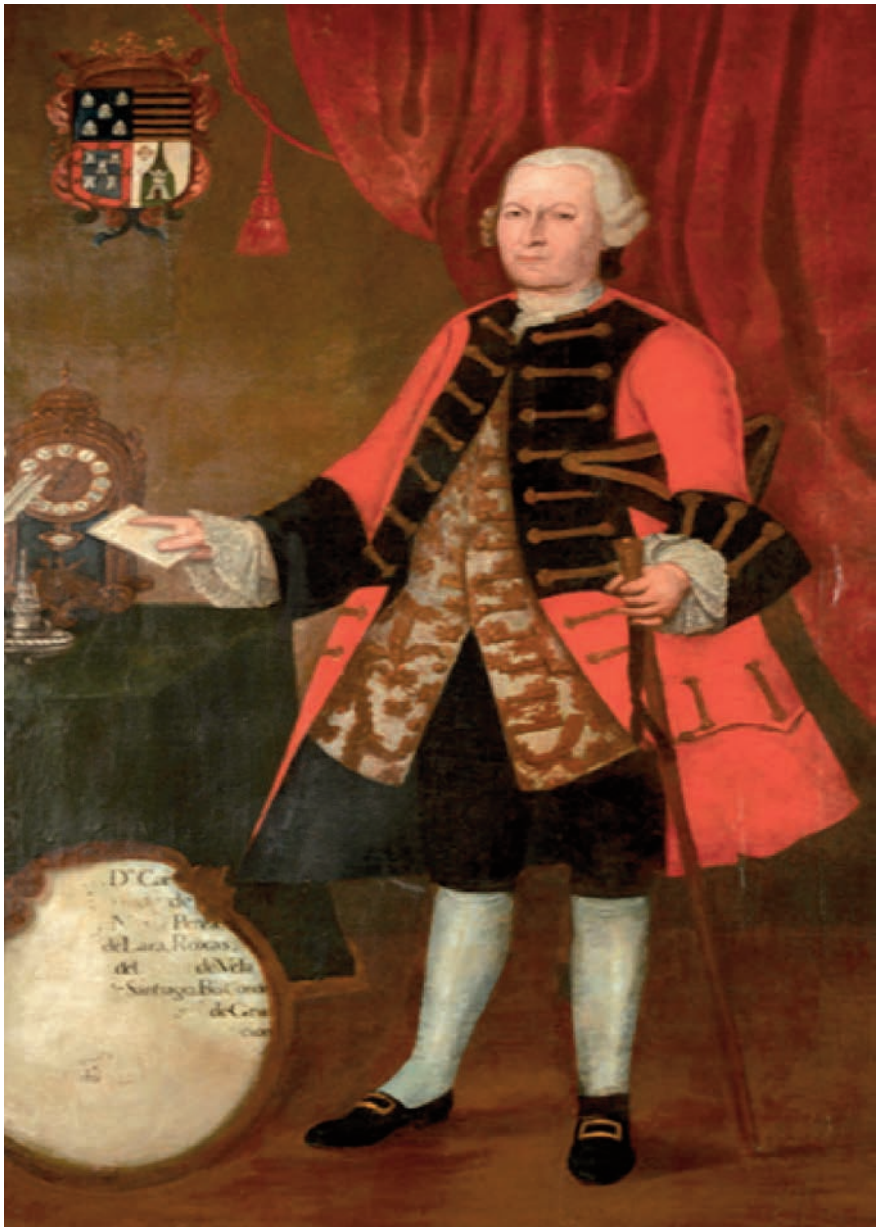
Don Carlos Francisco Pérez Manrique de Lara y Contreras, II Marqués de Santiago. Óleo por Cristóbal de Aguilar, 1769. Dimensiones: 211,5 x 116,4 cm Museo de la Nación, Lima-Perú.